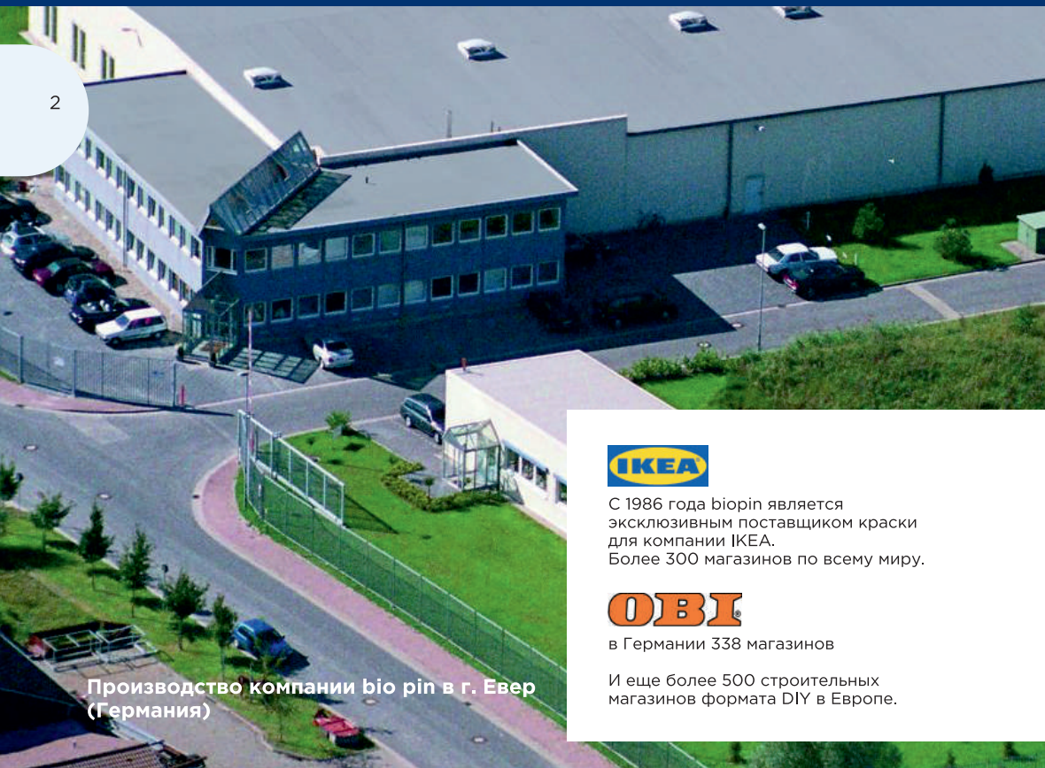
Производство компании biopin в г. Евер (Германия)